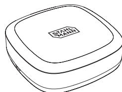
Рис. 1 Внешний вид датчика

Датчик протечки Stahlmann R868 предназначен для фиксации протечки воды и передачи, посредством радиоканала, аварийного сигнала на модули управления Stahlmann Smart и Stahlmann HUB.